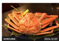
【福井・敦賀市】コレうまの旅！地元の人おすすめのご当...