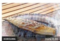
【福井・小浜市】コレうまの旅！地元の人おすすめのご当...